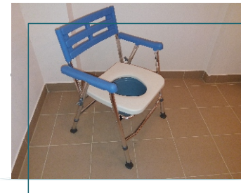
Krąg p/odleżynowy Krzesło obrotowe do wanny Krzesło rehabilitacyjne dla dzieci Krzesło sedesowe Krzesło sedesowe składane