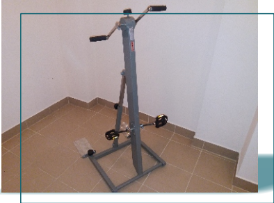
Rotor zespolony do ćwiczeń kończyn dolnych i górnych