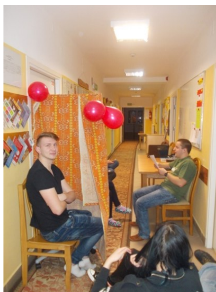
W trakcie zabawy

Ale pamiętajmy, że miłość warto okazywać codziennie, nie tylko w dzień Św. Walentego, gdyż to właśnie o wartości życia decydują nie czyny, choćby wielkie - ale miłość, chociaż mała :)