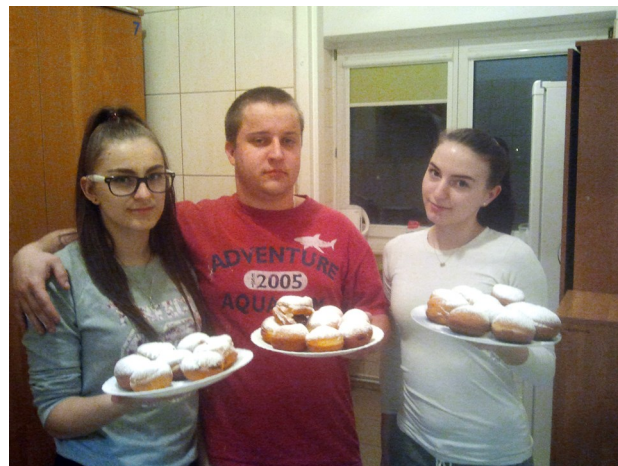
„od jutra zaczynamy dietę”

W związku z obchodzonym dniem „Tłusty Czwartek” 21 lutego wychowankowie Bursy - członkowie grupy kulinarnej, pod opieką p. M. Myćek przygotowali poczęstunek w postaci pysznych pączków. Wszyscy mieszkańcy Bursy wzięli udział we wspólnej degustacji.